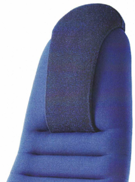
Volitelná varianta BP (bez podhlavníku)