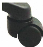
Kolečka pro měkké povrchy (KB)