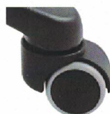
Kolečka pro tvrdé povrchy v (KT)